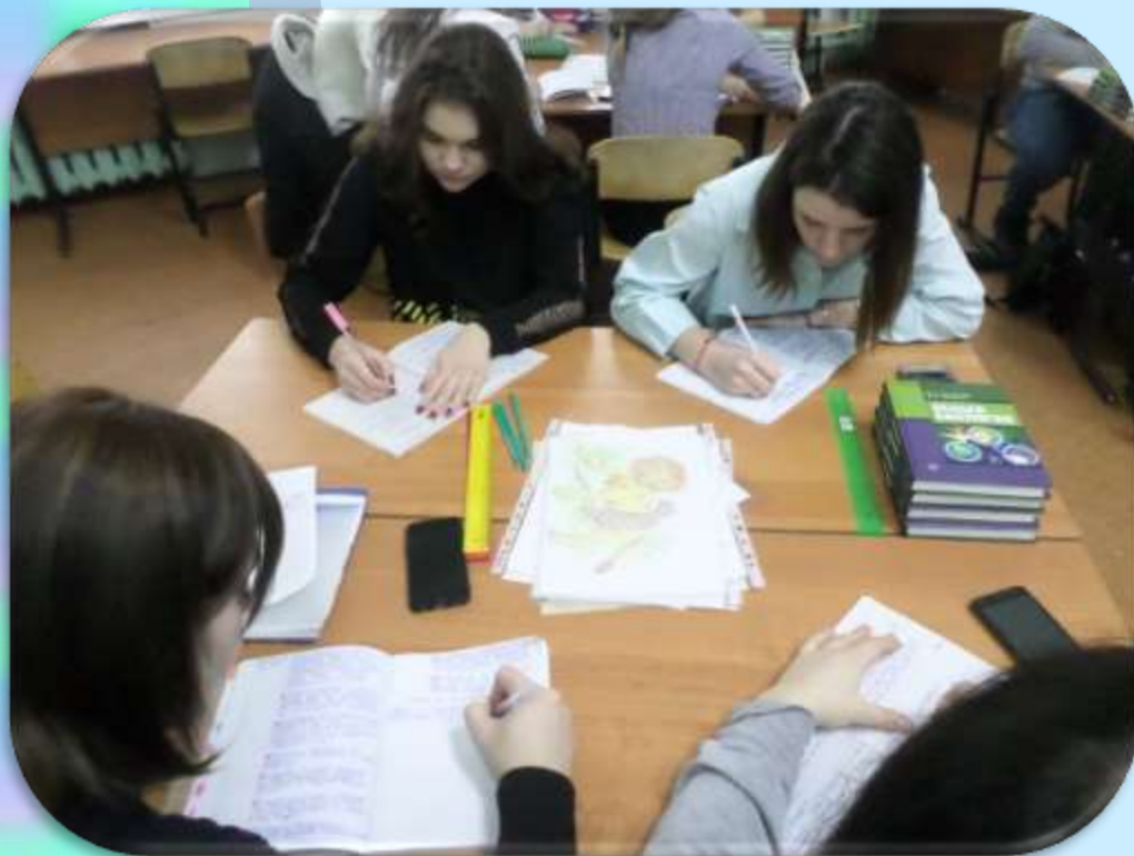
Работа в малых группах